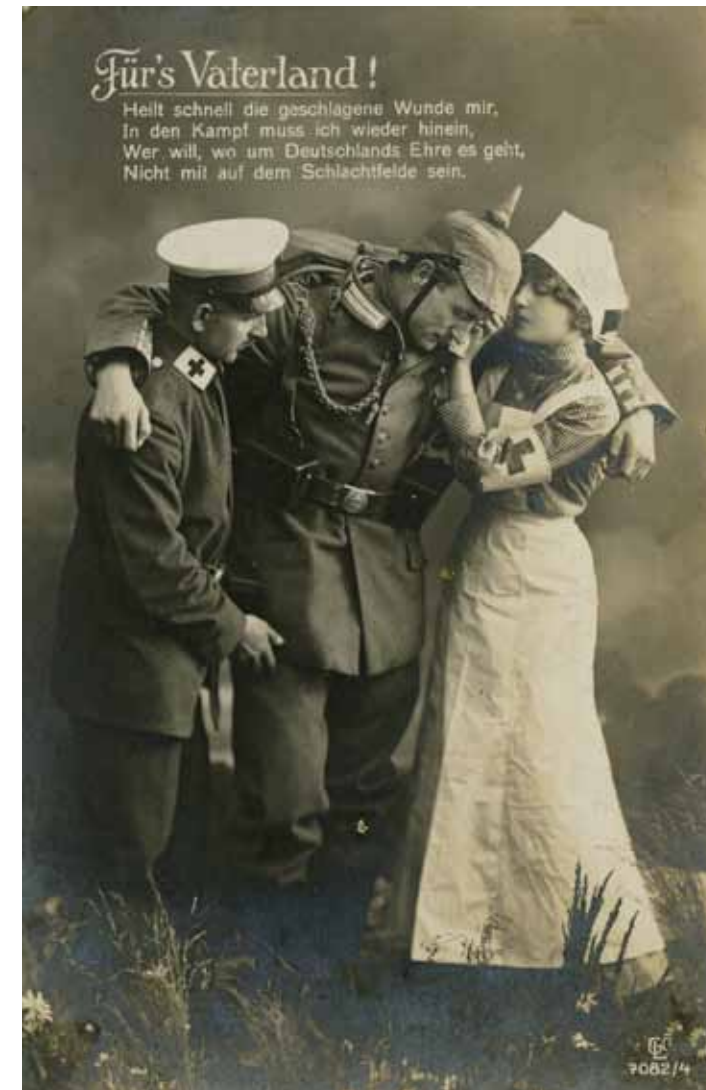
Propaganda- Bildpostkarte

merken, dass der Ton der „vaterländischen“ Dichtungen und opferfreudigen Hymnen uns so fremd geworden ist wie die pathetische Verklärung des „Heldentodes“ und dass die gefühlvollen Propaganda-Postkartenbilder von damals mittlerweile zu Kitsch geworden sind. Die Mentalität hat sich, wie gesagt, gewandelt, solche Melodien können die Rattenfänger von heute nicht mehr flöten.