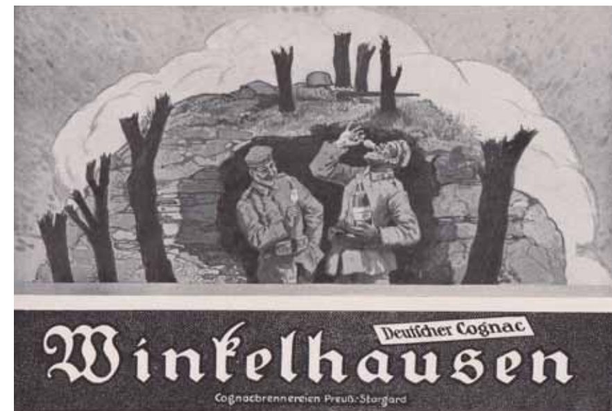
Der Schützen-graben als humoristisches Männer-Abenteuer: Weinbrand-Werbung in der Illustrierten Zeitung , Nr. 3913, 27. Juni 1918